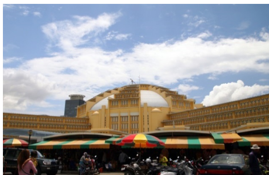
セントラルマーケット